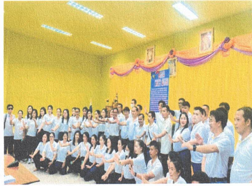
๒. จัดกิจกรรมการปลูกจิตสำนึก หรือสร้างวัฒนธรรมองค์กร No Gift Policy ประจำปีงบประมาณ พ.ศ. ๒๕๖๖ ณ องค์การบริหารส่วนตำบลห้วยข่า